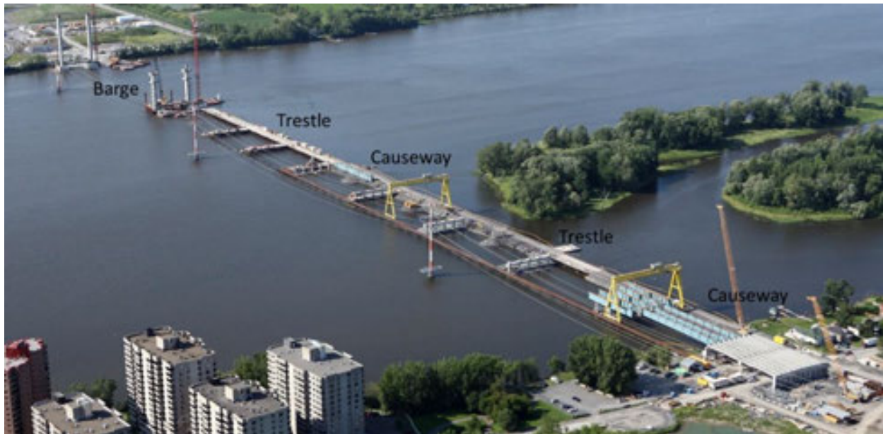
Figure 3. Exemple de méthode de construction (A25 - Québec)