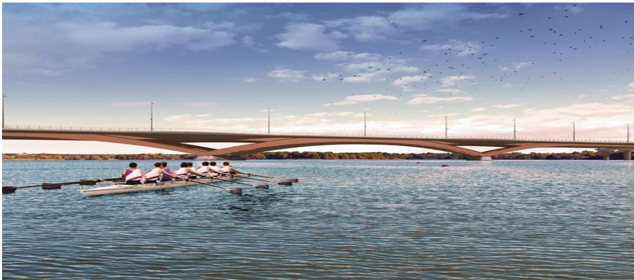
Figure 2. Vue de la troisième traversée du chenal de navigation proposée (au nord)